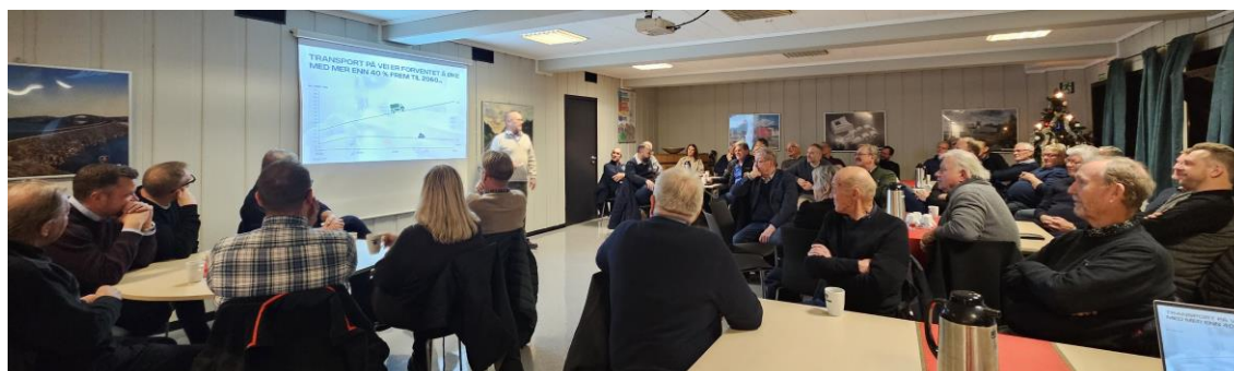
Lydhør forsamling hos Scania i Skien

NLF Telemark holdt sitt julemøte med Scania Skien som vertskap. Godt fremmøte, fin sosial ramme med deilig julemiddag og interessant faglig innhold gjorde det til en vellykket aften.