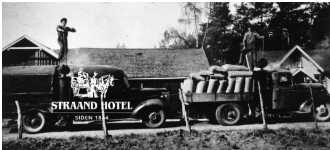
Mange lastebilfolk har vært innom Straand Hotel siden 1864 da det først var skystasjon.