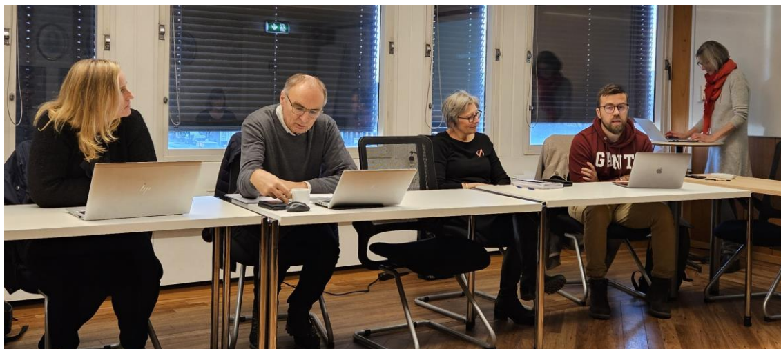
Fylkeskommunens representanter på dialogmøtet.

Standarden på fylkesveiene og det store vedlikeholdsetterslepet ble i tillegg til vektgrenser og fremkommelighet vesentlige tema i dialogen.