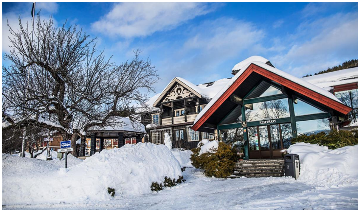
Straand Hotel i Vrådal i Telemark.

NLF Region 3 har berammet sin årskonferanse med fylkesårsmøter til 14. – 16. mars 2025. Sett av helgen til en nyttig og hyggelig helg på Straand Hotel i Vrådal i Telemark.